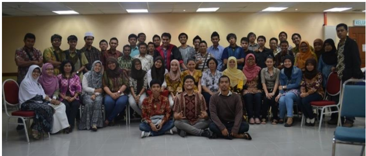
Suasana Rapat Kerja, Sabtu 3 November 2012

Pengurus Inti di atas dibantu oleh 5 Koordinator Bidang yang membawahi 11 Seksi beserta anggotanya sebagaimana terdapat pada Bab berikutnya.